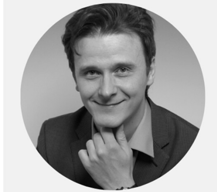
Sven Schneider Photogrammetrie (seit WS 24/25)